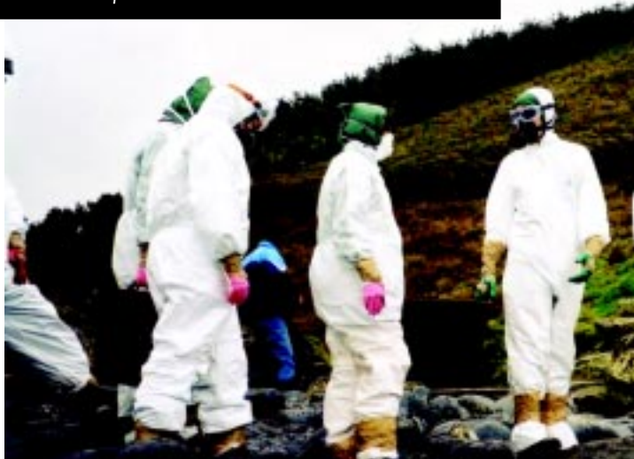
Za čiščenje nafte je potrebna popolna zaščitna oprema, obleka je vsak dan nova.