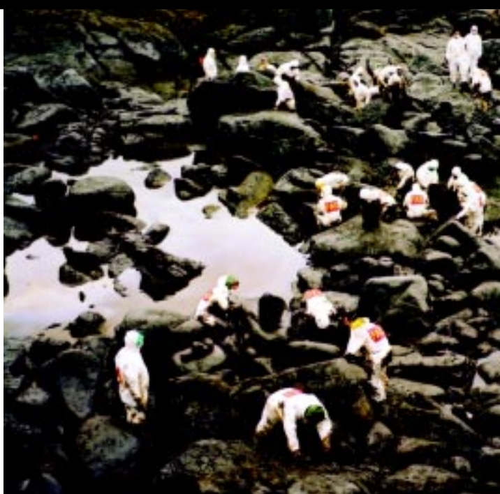
Prostovoljci na delu.