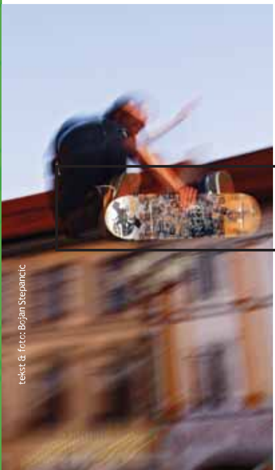
tekst & foto: Bojan Stepančič